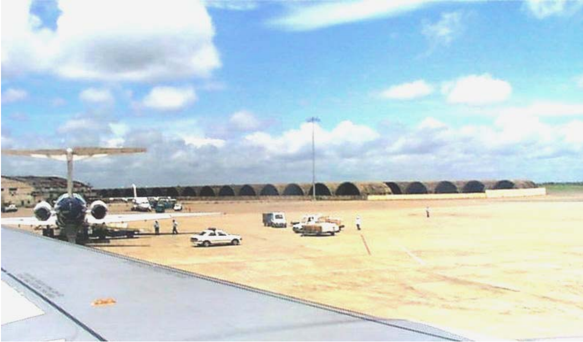
Phi trường Tân Sơn Nhứt