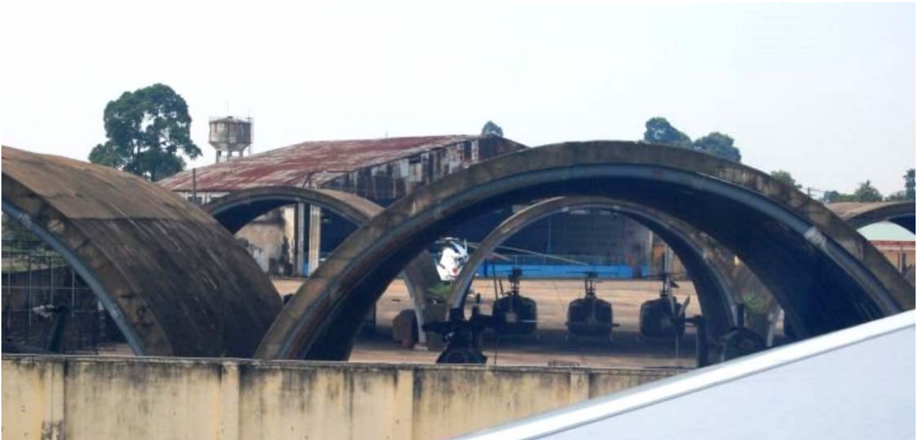
Phi trường Tân Sơn Nhứt 2008

Bây giờ đã quá chiều, Tôi cảm thấy rã rời, tìm vội một nơi ngả lưng dưới mái "Tent" căng tạm của Không lực Mỹ. Chưa được bao lâu, mọi người chộn rộn, lảng xảng xếp hàng chuẩn bị dùng bữa cơm chiều. Lúc đó tôi mới chợt nhớ suốt đêm hôm trước đến chiều hôm nay tôi chưa có gì lót dạ.