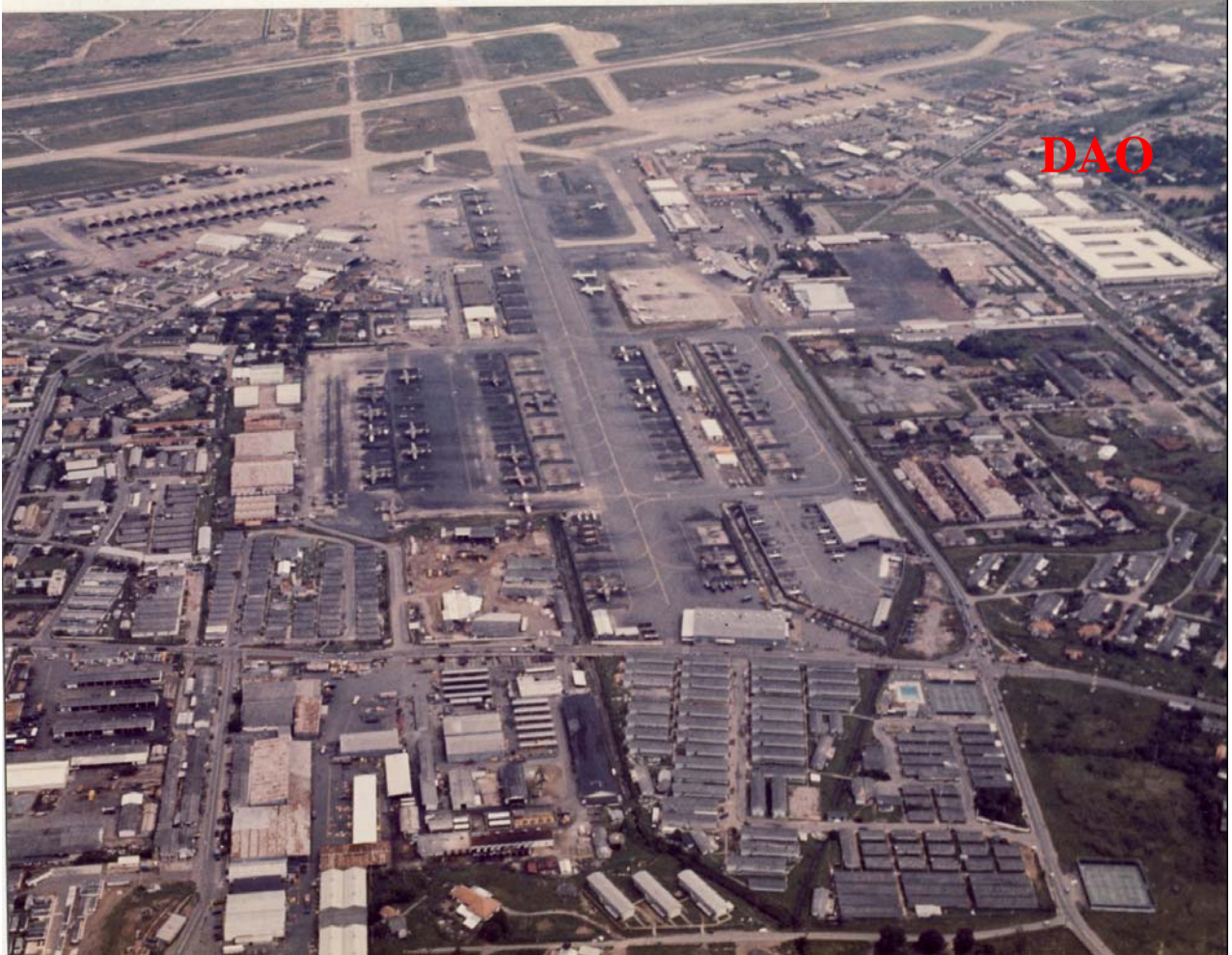
Defense Attache Office (DAO)

- Anh hãy nhận "Sao" này. Vừa nói vừa gắn "Sao" cho tôi.