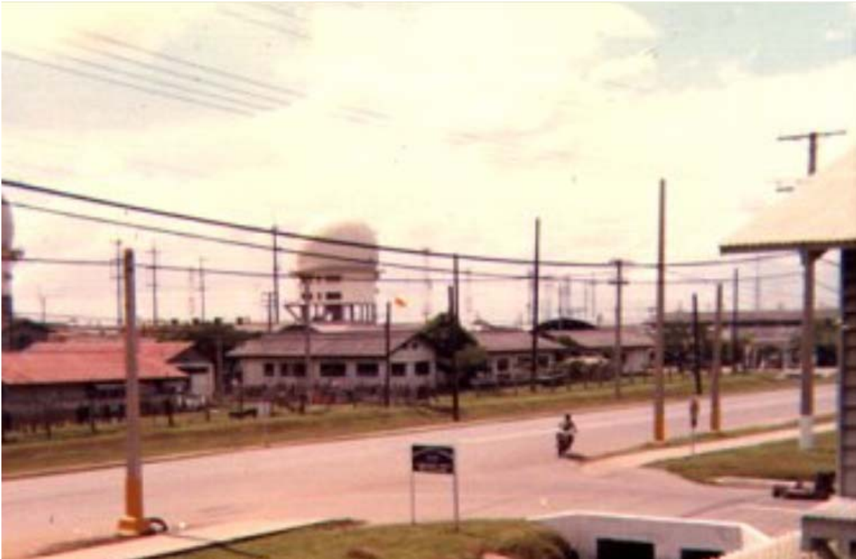
Phi trường Tân Sơn Nhứt - Trung Tâm Đài Kiểm Báo

chạy tới chạy lui như kiểu giao liên thời Du kích đánh Tây. Thanh tra vị trí chiến đấu vừa xong, tình hình cũng vừa lắng dịu. Tôi lên trình diện TLB những toan phúc trình tình hình phòng thủ nhưng chẳng ai bận tâm! Người người nhìn nhau đăm chiêu dường như trong thâm tâm mỗi người chỉ muốn buông rơi tất cả.