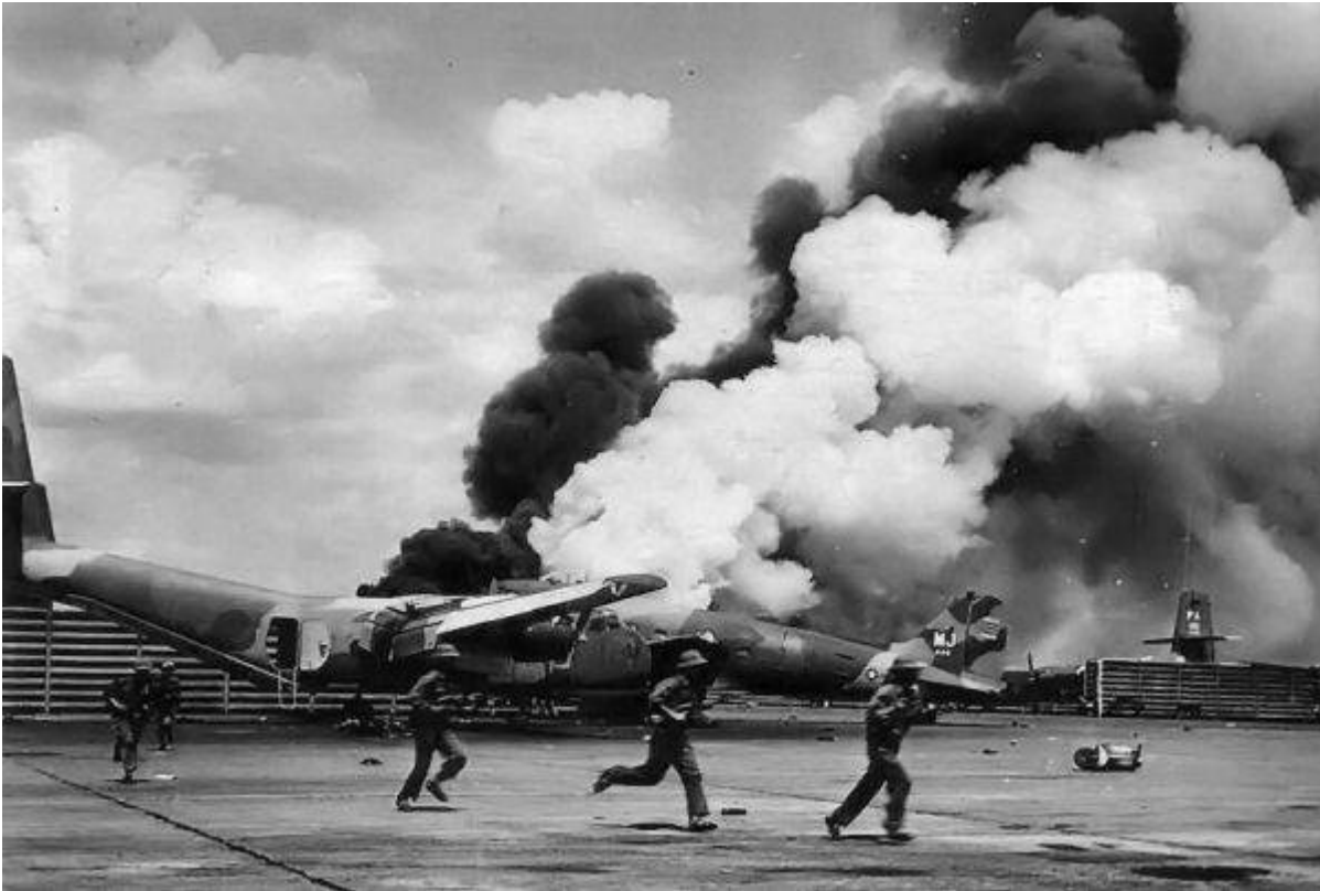
Phi trường Tân Sơn Nhứt

- Tại Tướng Tiên cho lệnh rút hết xăng khỏi tàu.